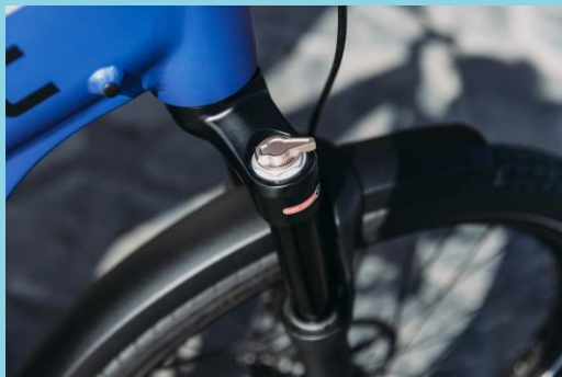
Geveerde voorvork (en zadelpen)?