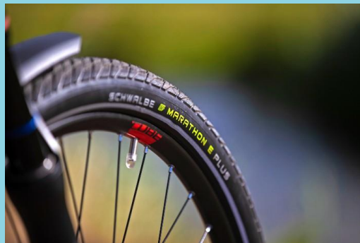
Type band (breedte, profiel, anti-lek...)?